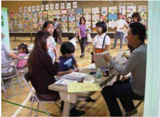
イベント「よい歯のつどい」