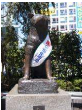
ハチ公も協力「歯の衛生週間」

歯の衛生週間では区との共催で「よい歯のつどい」が開催され、毎年何万人も集まる「ふるさと渋谷フェスティバル」では、会のブースにも多い年で1000人以上の方が訪れます。