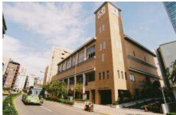
会立歯科診療所のある 「渋谷区ひがし健康プラザ」