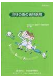
冊子「渋谷の街の歯科医院」