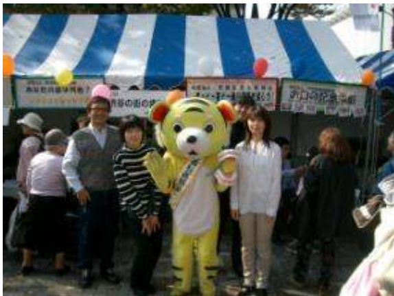
ふるさと渋谷フェスティバル