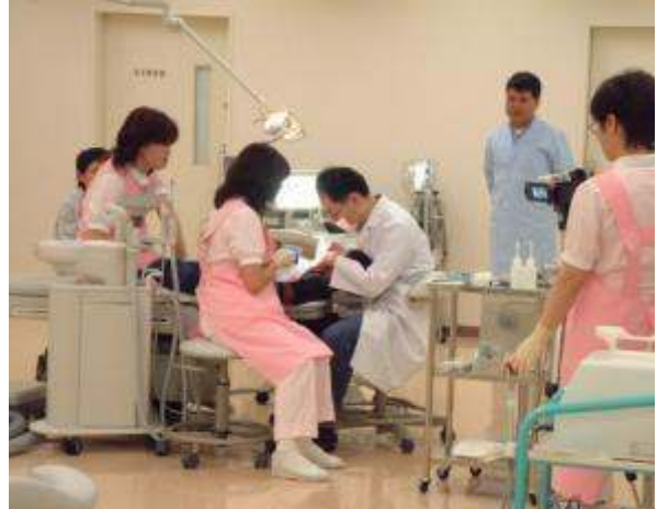
渋谷区ひがし健康プラザ歯科診療所