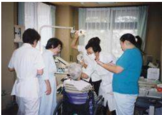
特養老人ホーム歯科健診 けやきの苑・西原