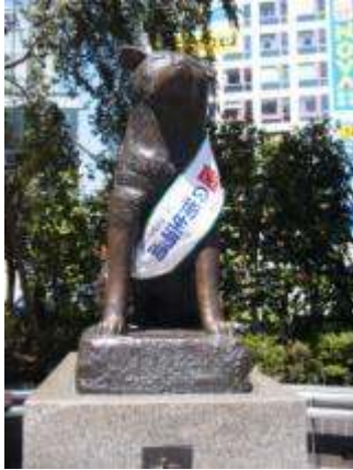
ハチ公も協力「歯の衛生週間」

「渋谷の街の歯科健診」が、「よい歯のつどい」が開催され、毎年何万人も集まる「ふるさと渋谷フェスティバル」では、会のブースにも多い年で1000人以上の方が訪れます。