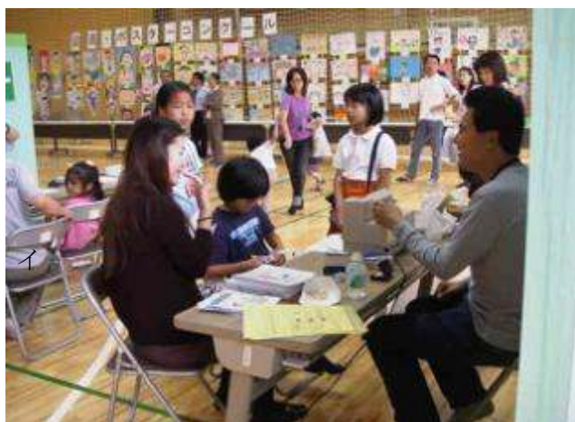
イベント「よい歯のつどい」