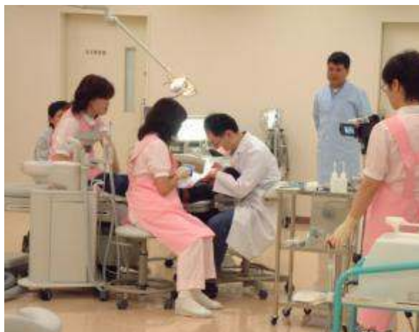
渋谷区ひがし健康プラザ歯科診療所