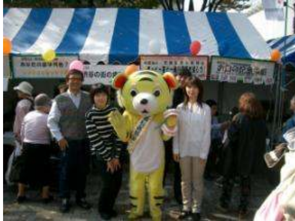
ふるさと渋谷フェスティバル