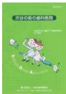
冊子「渋谷の街の歯科医院」